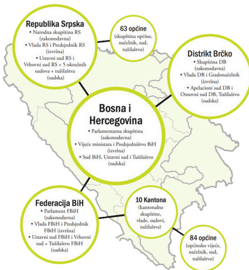
Grafika 1: Pojednostavljena šema vlasti u BiH

Slijedi pojednostavljena šema strukture i nivoa vlasti u BiH [3] :